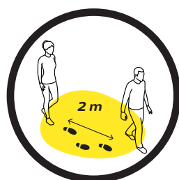
2 m Abstand zu anderen Personen 2 m Abstand in der Dusche